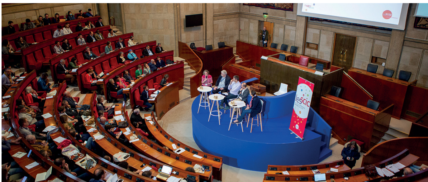
Les Scic ont fêté en octobre 2022 leurs 20 ans lors d'une Agora qui a réuni plus de 180 participants au CESE.

Depuis leur création en 2001, les Sociétés coopératives d'intérêt collectif (Scic) ont essaimé partout sur le territoire pour répondre aux besoins concrets des habitants et des collectivités. La CG des Scop et des Scic a continuellement fait la promotion du modèle et de ses fondamentaux : gouvernance multipartite, ancrage local, implication citoyenne et lucrativité limitée.